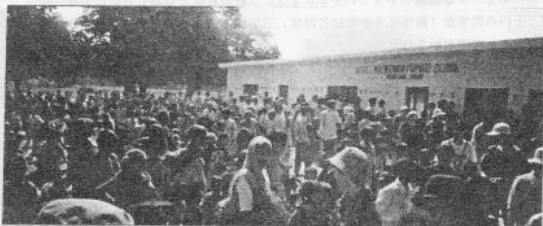
ルンビニのシリ・マズワニ小学校

私自身も少し忙しすぎるとは思いつつ、会の発展を、会員の方々の精力的な動き喜んでおりました。そして昨年暮れの間接調査と世界仏教サミット参加を、ミカノ会より派遣させていただきました。