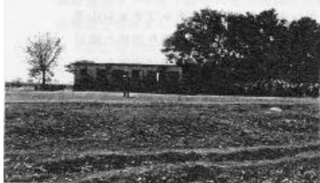
スリー・スリー・ラム小学校

「ネパールのバカデイ村、ルバンデヒ郡にあるラム小学校では生徒の数が250人以上。小学校としてこの人数が多いと思われる。人数が多い割には教室の数又は事務室は足りない状態です。この小学校では5年生までしかなくて近隣の村にも中学校又は高校学校はありません。従って中学校又は高等学校へ勉強を続けたい学生は遠くの村へ引越しなければなりません。遠う村に住み込んで勉強するのはこの学生にとってはあまりも出来ないことです。これは主な原因になり途中で学校を中退する学生が多いです。バカデイ村の学生は中退せずに勉強を続けられるようにするためにラム小学校では教室の数を増やさなければなりません。日本のネパールミカの会より教室利用の2室又は事務用の1室建てるとの援助を頂ければとてもありがたく思います。これについてのご検討をよろしくお願い致します」