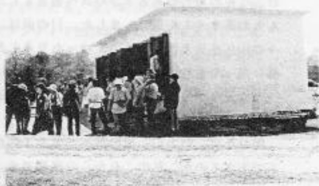
スリー・ルンビニ小学校