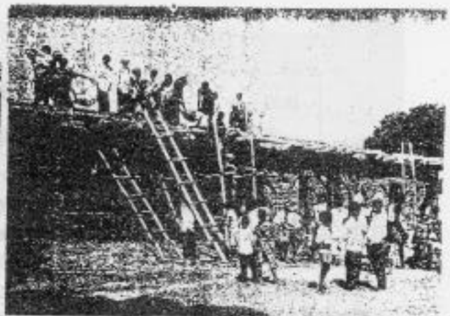
Labour At work