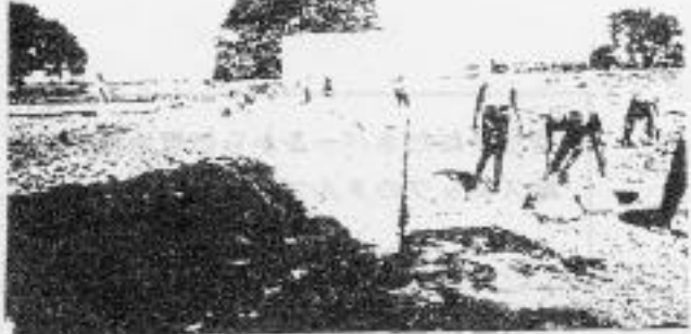
Earthwork Excavation for Foundation