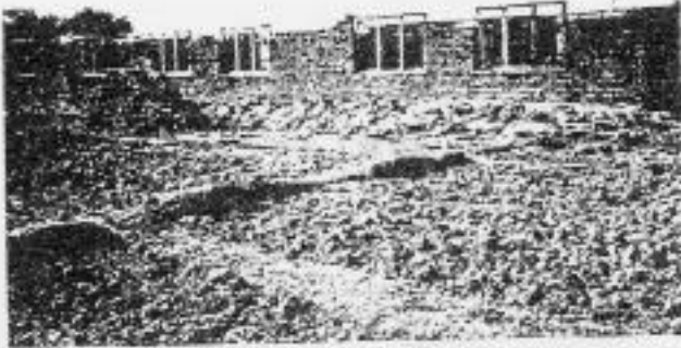
Work on Progress