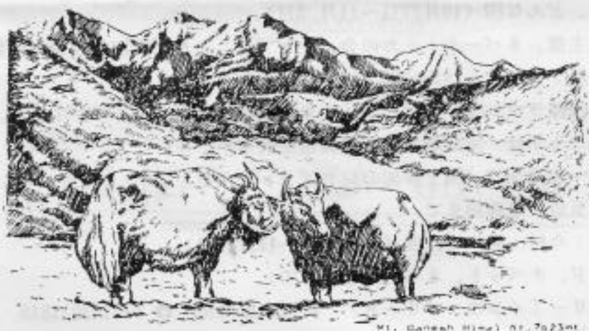
Mt. Ganesh Himal. 01. 702301

チベットは人も自然も美しい、けれどもこの先ずっとそうあり続ける事が出来るのでしょうか。ニューラムから国境の街ダムへ溪谷をぐんぐん下っていく。同時にチベット高原にはなかった緑の木々があふれ、気温と湿度も上昇していく。チベットに別れを告げ友誼橋を渡ってネパールのコダリへ。三度目のネパールなので「帰ってきた」という感じだ。次回は聖山、カイラスへ行きます。自転車で。