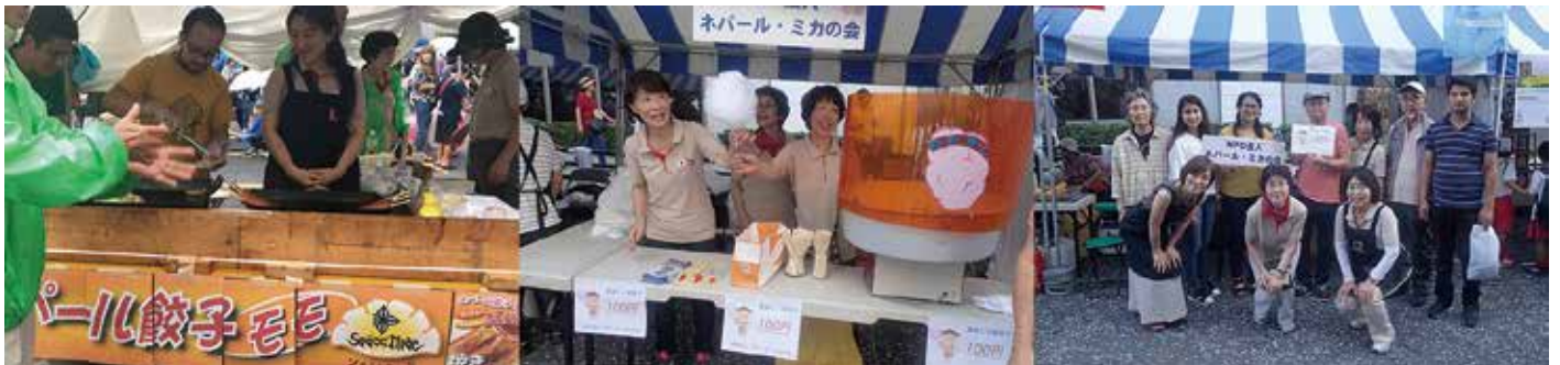
2018.09.02 (日) 栄通りフェスタ：初めてのネパール餃子とフランクフルト販売でしたがおかげさまで完売。