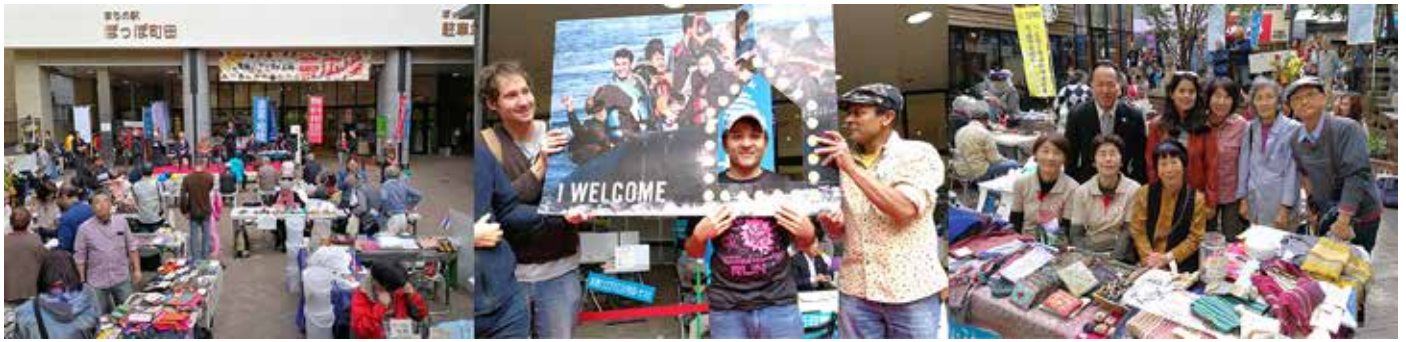
2018.11.03 (祝) 第21回 町田発 国際交流フェスティバル『夢広場』 私達 NPO 法人 ネパール・ミカの会がスタートさせたフェスティバルも 21 回を迎えました。 町田市の国際交流団体の基盤となったイベントです。