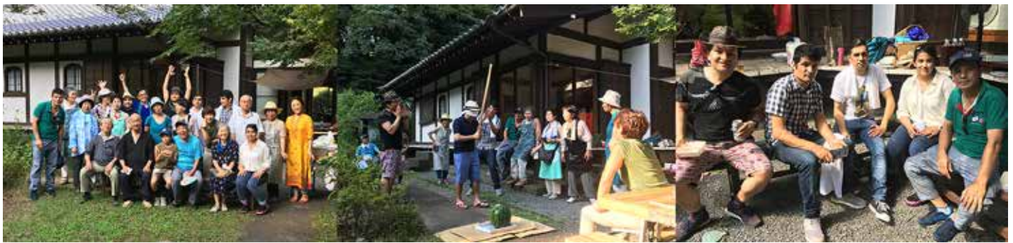
2018.07.14 移動例会・BBQ: 延 26 名の参加で猛暑の午後を楽しくすごく事ができました。ネパールの方の参加も花を添えてくれました。ネパールの参加者に配慮して牛肉なしの BBQ。多めに飲んで、食べて、踊って楽しい BBQ でした。設営、差し入れ、調理、片づけと忙しかった皆さんご苦労様でした。また来年もぜひ。