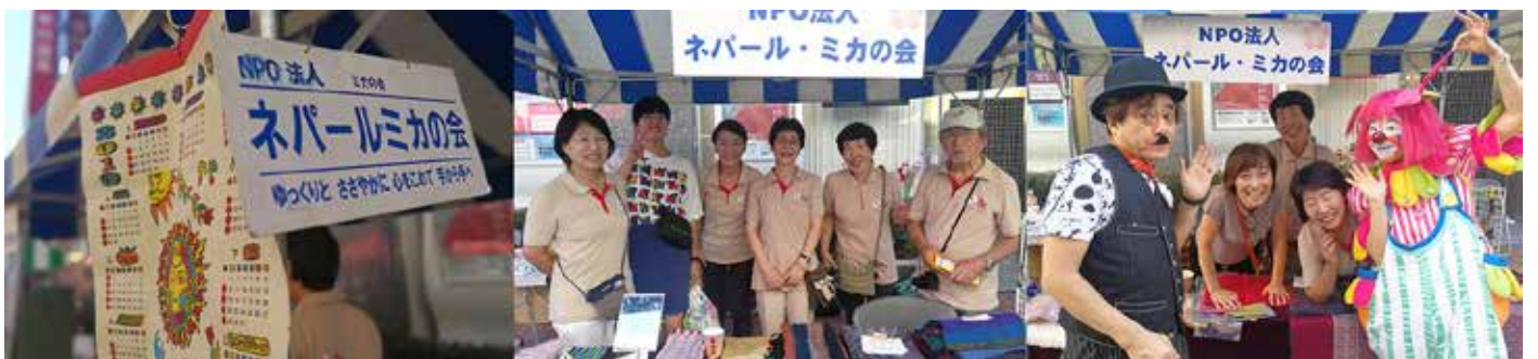
2018.10.06-07 (土・日) 町田大道芸 民芸品とリサイクル品の出店です。このイベントもパークアベニュー商店会様のご好意で無料で出店させて頂いています。本当にありがとうございます。

それぞれ、栄通り商店会・パークアベニュー商店会様のご好意で出店させていただいております。感謝申し上げます。